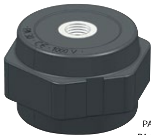
PA 30 M8 PA 30 M10

Podpěrné izolátory PROFIX PA jsou určeny především k montáži a pevnému uchycení přípojnicových systémů, sběrnic, svorkovnic, kabelových vývodů, živých částí přístrojů a jiných elektrotechnických zařízení.