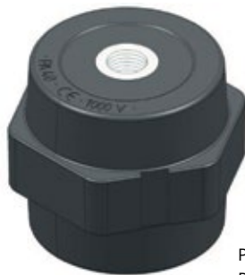
PA 40 M8 PA 40 M10 PA 40 M12