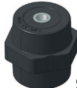
PA 50 M8 PA 50 M10 PA 50 M12